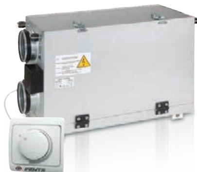
Regulator prędkości RS-1-400

Nawiewno-wywiewna centrala wentylacyjna z odzyskiem ciepła o wydajności do 300 m 3 /h , w kompaktowej, izolowanej obudowie, z poziomym usytuowaniem króćców. Sprawność rekuperacji do 65%.