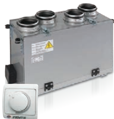
Regulator prędkości RS-1-400

Nawiewno-wywiewna centrala wentylacyjna z odzyskiem ciepła o wydajności do 300 m 3 /h , w kompaktowej, izolowanej obudowie, z pionowym usytuowaniem króćców. Sprawność rekuperacji do 65%.